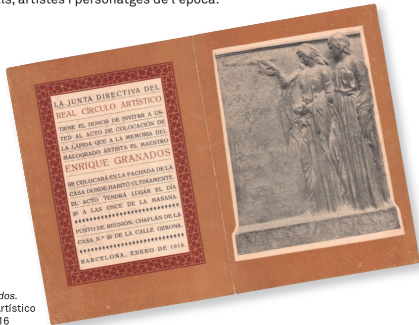
Homenatge a Enric Granados. Real Círculo Artístico Programa, 1916 Museu Abelló

La figura del compositor lleidatà té una presència destacada a les col·leccions dels museus de la Xarxa de Museus de la Diputació de Barcelona. A partir d'aquests fons es planteja un breu recorregut que aborda la seva figura i l'impacte de la seva mort, la font d'inspiració i la connexió amb Goya i, finalment, el seu cercle d'amistats amb intel·lectuals, artistes i personatges de l'època.