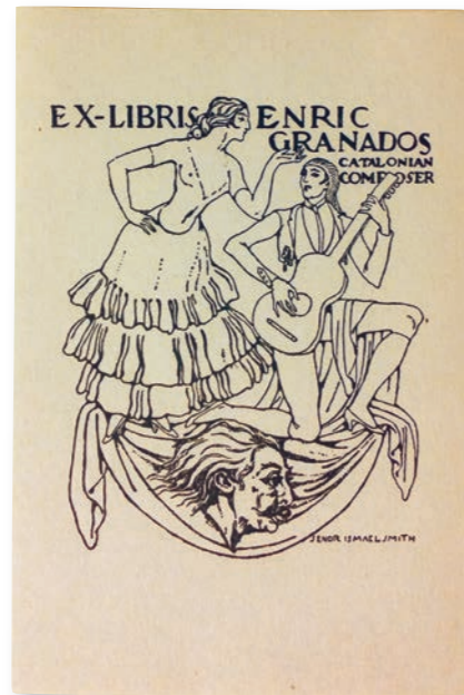
Ex-libris per a Enric Granados Primer quart del segle xx Fundació Palau

Al marge de Goyescas , va destacar en les composicions per a piano, com ara Capricho español o Seis escenas romànticas . També en sobresurten les obres líriques, amb text d'Apel·les Mestres, Picanyol , Follet , Gaziel i Liliana , i cançons com Las tonadillas . Dins de la seva producció destaquen les Danzas españolas . Granados pertany a l'època d'esplendor del modernisme, i amb Albéniz, se'l considera el creador de l'escola catalana moderna de piano. A diversos museus de la xarxa es conserven documents gràfics i escrits que mostren l'èxit de la seva carrera i la repercussió de la seva desaparició.