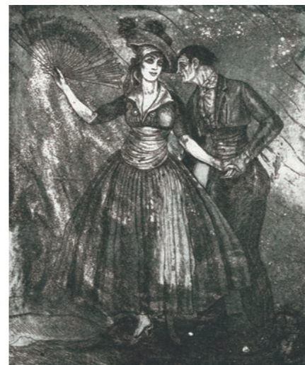
Gravat, 1919. Ismael Smith Museu d'Art de Cerdanyola