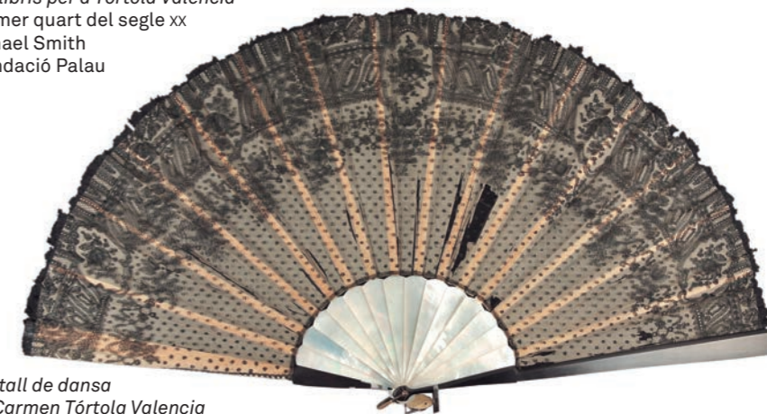
Ventall de dansa de Carmen Tórtola Valencia Segona meitat del segle XIX Museu d'Arenys de Mar Dipòsit del Col·legi d'Art Major de la Seda

Text: Txema Romero (Museu d'Art de Cerdanyola)