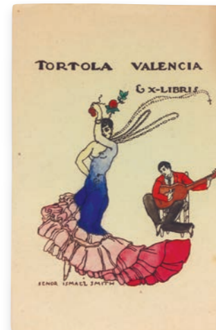
Ex-libris per a Tórtola Valencia Primer quart del segle xx Ismael Smith Fundació Palau