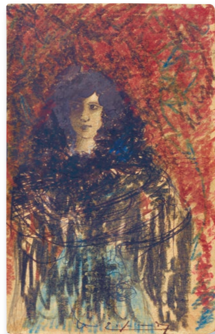
Dibuix, llapis de color i tinta Enric Granados. Museu de la Música

Aiguafort de la sèrie «Capritxos», núm. 61, 6a edició (any 1899-1900) Francisco de Goya y Lucientes Fundació Palau