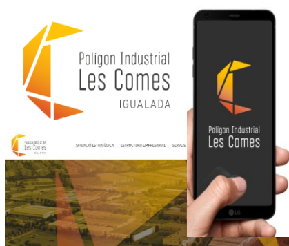
Polígon Industrial Les Comes d'Igualada SOM UN POLÍGON URBÀ SITUAT A LA CAPITAL DE LA COMARCA DE L'ANOIA