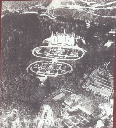
Vista aèria del Palau de les Hores en un mapa del 1868. El Foto que Revolucion, elaborada el 1925